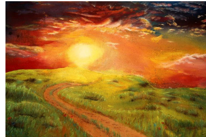
"Der Weg zum Licht" von Nelli Bayer - Siegerin Erwachsene 2013