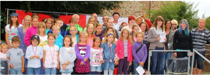
Sieger des 5. Straßenmalerfestivals am 18.08.2013